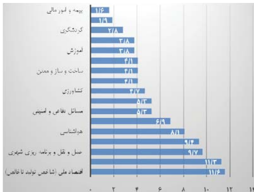
شکل (۹): سهم (درصد) مطالعات صورت گرفته در مورد بررسی اثرات اقتصادی-اجتماعی فعالیت‌های فضایی بر روی بخش‌های مختلف اقتصاد (۱۹۷۲-۲۰۱۸) [۳].

می‌رسد از آن زمان به بعد بخش‌های مختلف اقتصاد از اثرات اقتصادی-اجتماعی این گونه سرمایه‌گذاری‌ها منتفع شده‌اند. گزارش انجام شده توسط سازمان همکاری و توسعه اقتصادی در سال ۲۰۱۹ نشان می‌دهد که از حدود ۷۷ مطالعه صورت گرفته درباره اثرات اقتصادی-اجتماعی فعالیت‌های فضایی در بخش‌های اقتصادی در بازه زمانی ۱۹۷۲ تا ۲۰۱۸، دو حوزه اقتصاد ملی (با ۱۱/۶ درصد) و مسائل زیست محیطی (با ۱۱/۳ درصد) بیشترین مطالعات انجام شده را به خود اختصاص داده‌اند. شکل ۱ میزان سهم مطالعات صورت گرفته روی بعضی از بخش‌های اقتصادی در بازه زمانی مذکور را نشان می‌دهد [۳]. همچنین، از لحاظ نوع اثرات مثبتی که سرمایه‌گذاری‌های فضایی در پی دارند، درآمدهای تجاری با ۱۵/۴ درصد بیشترین سهم را به خود اختصاص داده است (شکل ۲).