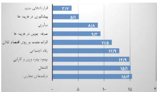
شکل (۱۰): سهم (درصد) انواع اثرات مثبت بدست آمده از سرمایه‌گذاری‌های فضایی (۱۹۷۳-۲۰۱۸) [۳].

در واقع، اجرای پروژه‌های فضایی باعث ایجاد جریان‌های درآمدی جدید برای شرکت‌های فعال در صنعت شده و این جریان‌های درآمدی اغلب به بخش‌های فراتر از صنعت فضایی نیز سرازیر می‌شود. یکی از پیامدهای این درآمدهای تجاری جدید خود را در بازار کار و ایجاد اشتغال جدید نشان می‌دهد.