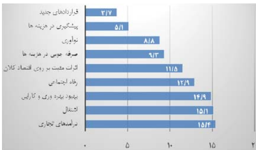
شکل (۲): سهم (درصد) انواع اثرات مثبت بدست آمده از سرمایه‌گذاری‌های فضایی (۱۹۷۲-۲۰۱۸) [۳].

گذاشته‌اند را ارائه می‌دهد. همچنین در این بررسی مروری، بعضی از چالش‌های موجود در ادبیات برای ارزیابی بهتر و بیشتر سرمایه‌گذاری‌های فضایی در آینده را شناسایی می‌کنیم.