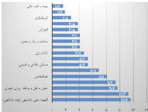
شکل (۱): سهم (درصد) مطالعات صورت گرفته در مورد بررسی اثرات اقتصادی-اجتماعی فعالیت‌های فضایی بر روی بخش‌های مختلف اقتصاد (۱۹۷۲-۲۰۱۸) [۳].

می‌رسد از آن زمان به بعد بخش‌های مختلف اقتصاد از اثرات اقتصادی-اجتماعی این گونه سرمایه‌گذاری‌ها منتفع شده‌اند. گزارش انجام شده توسط سازمان همکاری و توسعه اقتصادی در سال ۲۰۱۹ نشان می‌دهد که از حدود ۷۷ مطالعه صورت گرفته درباره اثرات اقتصادی-اجتماعی فعالیت‌های فضایی در بخش‌های اقتصادی در بازه زمانی ۱۹۷۲ تا ۲۰۱۸، دو حوزه اقتصاد ملی (با ۱۱/۶ درصد) و مسائل زیست محیطی (با ۱۱/۳ درصد) بیشترین مطالعات انجام شده را به خود اختصاص داده‌اند. شکل ۱ میزان سهم مطالعات صورت گرفته روی بعضی از بخش‌های اقتصادی در بازه زمانی مذکور را نشان می‌دهد [۳]. همچنین، از لحاظ نوع اثرات مثبتی که سرمایه‌گذاری‌های فضایی در پی دارند، درآمدهای تجاری با ۱۵/۴ درصد بیشترین سهم را به خود اختصاص داده است (شکل ۲).