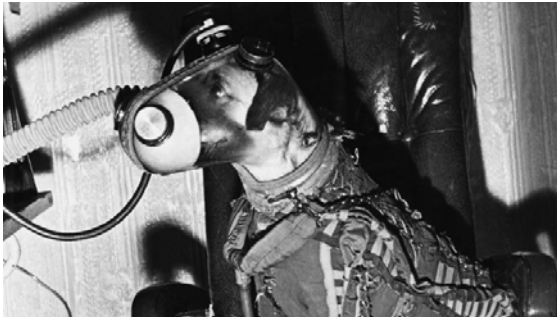
شکل ۱- اولین موجود زنده در فضا، سگی ماده به نام لایکا [۵].

فرستادند و این سگ در واقع اولین موجود زنده ای بود که از زمین به فضا فرستاده شد و به دور زمین گردید (شکل ۱). این سگ متأسفانه به علت یک مشکل فنی در اسپوتنیک ۲ به هلاکت رسید [۴].