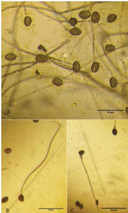
شکل ۲- (A) رشد و رویش لوله‌های گرده در محیط کشت مایع (شامل) پس از مدت زمان شش ساعت تحت شرایط کنترل زمینی ۱g، (B) رشد و رویش لوله‌های گرده تحت شرایط کنترل زمینی ۱g و (C) رشد و رویش لوله‌های گرده تحت شرایط میکروگروایتی القایی (کلینواست).

درصد سوکروز، ۱/۶ میلی مول H 3 BO 3 ، ۱ میلی مول KCl، ۰/۱ میلی مول CaCl 2 و تنظیم پی اچ روی ۵/۷، برای رشد و رویش لوله‌های گرده این گونه استفاده شد که پس از مدت زمان شش ساعت حدود ۹۰ درصد لوله‌های گرده رویش نمودند. مشاهدات میکروسکوپی از لحاظ مورفولوژی یا ریخت‌شناسی لوله گرده تفاوت آشکاری را بین نمونه‌های کنترل ۱g و میکروگروایتی نشان نداد (شکل ۲).