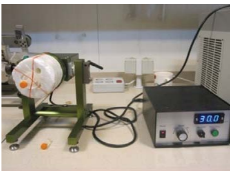
شکل ۱- نحوه سوار کردن کرایوتیوپ حاوی نمونه روی دستگاه.

کرایوتیوپ‌های حاوی محیط کشت و نمونه به صورت افقی روی زمین قرار داده شد. سرعت دستگاه روی ۳۰ rpm تنظیم شد. مدت زمان رویش دانه‌های گرده تحت تیمار بی‌وزنی و ۱g دو ساعت بود (شکل ۱). پس از اتمام مدت زمان اینکوباسیون، برای توقف فرآیندهای زیستی و جلوگیری از پاسخ لوله‌های گرده به جاذبه، نمونه‌ها بلافاصله پس از جدا شدن از دستگاه در محلول فیکساتور استیک: اتانول با حجم برابر با محیط کشت قرار داده شد. نمونه‌های تحت شرایط ۱g نیز به منظور توقف فرآیندهای زیستی درون محلول فیکساتور قرار داده شد.