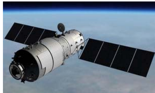
شکل ۱۷- ایستگاه فضایی تیان گونگ ۱ [۲۴].

سازمان‌های فضایی روسیه و هندوستان اکنون در حال برنامه ریزی مأموریت لونا ۲۷ (کاوشگران لونا) هستند. ۶۱ این طرح در نظر دارد به سوی هر کدام از دو کلاهک قطبی ماه دو کاوشگر بفرستد. آن‌ها وظیفه دارند که در آنجا به جستجوی آب و مواد خام بپردازند. از آنجا که شورای وزیران سازمان فضایی اروپا با مأموریت ماه که به توسط خود اروپایی‌ها انجام گیرد، مخالفت نموده است، سازمان فضایی اروپا می‌تواند در مأموریت