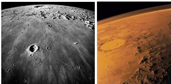
شکل ۱۶- ماه و مریخ، اهداف مأموریت‌های آورو در زمینه اعزام انسان [۲۳].

تلاش دیگر آن‌ها، هوپر ۵۲ بود که فضاییامی است که می‌بایست بدون کمک موشک‌های اضافی به یک مدار نزدیک زمین می‌رسید. نمونه اولیه کوچک ولی با همان مقیاس‌های همانند نسخه اصلی آن، فونیکس ۵۳ در ماه مه ۲۰۰۴ در شمال سوئد با موفقیت آزمایش شد. همچنین سازمان فضایی اروپا در چارچوب برنامه آورو (به معنای سپیده دم) ۵۴ مشغول برنامه ریزی برای اعزام انسان به مریخ می‌باشد (شکل ۱۶). این برنامه در نظر دارد بر روی ماه و مریخ تحقیقات بیشتری انجام دهد و به آماده سازی برای اعزام انسان به مریخ بپردازد (در نظر گرفته شده برای سال‌های دهه ۲۰۳۰ و یا ۲۰۴۰).