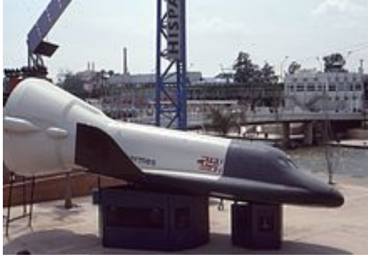
شکل ۱۵- فضاییامی (مدارگرد) «هرمس» (پروژه متوقف گشته) [۲۲].

تلاش دیگر آن‌ها، هوپر ۵۲ بود که فضاییامی است که می‌بایست بدون کمک موشک‌های اضافی به یک مدار نزدیک زمین می‌رسید. نمونه اولیه کوچک ولی با همان مقیاس‌های همانند نسخه اصلی آن، فونیکس ۵۳ در ماه مه ۲۰۰۴ در شمال سوئد با موفقیت آزمایش شد. همچنین سازمان فضایی اروپا در چارچوب برنامه آورو (به معنای سپیده دم) ۵۴ مشغول برنامه ریزی برای اعزام انسان به مریخ می‌باشد (شکل ۱۶). این برنامه در نظر دارد بر روی ماه و مریخ تحقیقات بیشتری انجام دهد و به آماده سازی برای اعزام انسان به مریخ بپردازد (در نظر گرفته شده برای سال‌های دهه ۲۰۳۰ و یا ۲۰۴۰).