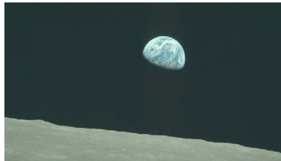
شکل ۷- «کره زمین» - عکس گرفته شده توسط فضانورد ویلیام آندرس در حین مأموریت آپولو ۸ [۱۳].

۱۰ مرتبه به دور ماه چرخیدند و سالم به زمین بازگشتند. در این میان روس‌ها در راه رسیدن به ماه صاحب موفقیت‌های چشمگیری نشدند و در واقع در این مرحله از مسابقه (رقابت فضایی) عقب ماندند و باختند. پس از مأموریت آپولو ۸ چندین آزمایش دیگر و نیز مانور عملیات اتصال به‌وسیله ماه نورد و نیز شبیه‌سازی فرود در مدار ماه انجام شد.