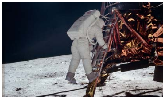
شکل ۸- باز آلدین به هنگام پیاده شدن از کپسول فرود آمده بر روی ماه [۱۴].

و سرانجام زمان موعود فرا رسید: در روز ۲۹ ژولای ۱۹۶۹ سه فضانورد آمریکایی نیل آرمسترانگ ۲۰ - میسائل کولینز ۲۱ - باز (ادوین) آلدین ۲۲ به توسط مأموریت آپولو ۱۱ موفق به اولین فرود بر روی کره ماه شدند (شکل ۸). در آن زمان، ۶۰۰ میلیون انسان بر روی کره زمین تماشاگر این صحنه بودند که چگونه این دو فضانورد (آرمسترانگ و آلدین) مدت دو ساعت و نیم را بر روی سطح کره ماه سپری کردند و در آنجا مقدار ۲۱ کیلو گرم از سنگ‌های کره ماه را جمع‌آوری نمودند. این سه قهرمان، پس از بازگشتشان به زمین می‌بایست ۱۷ روز را در قرنطینه به سر می‌بردند: ترس ناسا از موجودات فضایی ناشناخته بود. پس از آن و به همین مناسبت، در نیویورک جشنی بزرگ به همراه رژه برگزار گردید. با مأموریت آپولو ۱۷ برنامه آمریکایی ماه نیز بطور کامل به اتمام رسید.