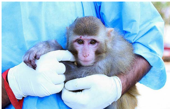
شکل ۱۸- میمون فضایی ایران [۲۶].

اولویت قرار دارد و این پروژه باید تا سال ۱۴۰۴ هجری شمسی (۲۰۲۵ میلادی) انجام یابد.