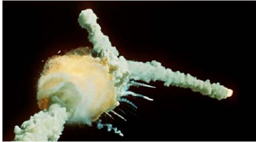
شکل ۱۰- ۲۸ ژانویه/۱۹۸۶ - انفجار چلنجر [۱۷].

در روز ۲۴ آوریل همان سال، فضانورد چهل ساله اهل شوروی، ولادیمیر کاماروف ۳۰ ، دچار مشکلاتی بر روی عرشه سفینه فضایی از نوع جدید سایوز ۱ شد. کمی قبل از آن در موقع پرواز، چندین مشکل فنی بوجود آمد، به طوری که تصمیم برای فرود زودهنگام گرفته شد. در هنگام آخرین گردش به دور زمین، آن سفینه فضایی به شدت دچار تکان خوردن‌های شدید شد و کاماروف در آخرین لحظات موفق شد کپسول را به وسیله کنترل دستی فرود آورد اما رشته‌های چتر نجات در این حالت نوسان و تکان، در هم ریختند و کاماروف بدون توقف بر زمین سقوط کرد. کاماروف (شکل ۹) اولین فضانورد قربانی بود که در هنگام مأموریتش در فضا جانش را از دست داد. فضانوردان ناسا نیز تلگراف‌های تسلیت خود را ارسال کردند.