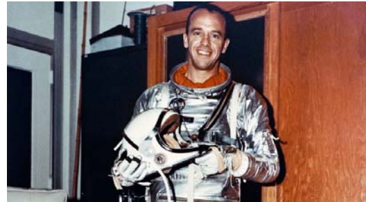
شکل ۳- آلن شپارد، اولین آمریکایی در فضا [۷].

دور زمین نچرخید بلکه در کپسول فضایی خودش فقط یک پرواز بالستیک انجام داد و به ارتفاع ۱۸۷ کیلومتری زمین رسید.