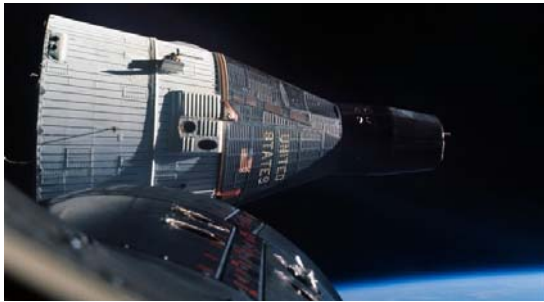
شکل ۵- تلاش برای اتصال بین گمینی ۶ و ۷ [۱۰].

تکامل یافته تر شد. فضانورد آمریکایی اد وایت نیز در این میان موفق به انجام یک گردش در فضا شد.