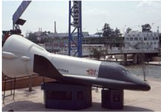
شکل ۱۵- فضاییامی (مدارگرد) «هرمس» (پروژه متوقف گشته) [۲۲].

تلاش دیگر آن‌ها، هوپر ۵۲ بود که فضاییامی است که می‌بایست بدون کمک موشک‌های اضافی به یک مدار نزدیک زمین می‌رسید. نمونه اولیه کوچک ولی با همان مقیاس‌های همانند نسخه اصلی آن، فونیکس ۵۳ در ماه مه ۲۰۰۴ در شمال سوئد با موفقیت آزمایش شد. همچنین سازمان فضایی اروپا در چارچوب برنامه آورو را (به معنای سپیده دم) ۵۴ مشغول برنامه ریزی برای اعزام انسان به مریخ می‌باشد (شکل ۱۶). این برنامه در نظر دارد بر روی ماه و مریخ تحقیقات بیشتری انجام دهد و به آماده سازی برای اعزام انسان به مریخ بپردازد (در نظر گرفته شده برای سال‌های دهه ۲۰۳۰ و یا ۲۰۴۰).