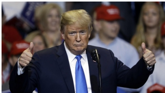
شکل ۱۹- شادی دونالد ترامپ به خاطر برنامه‌های ناسا [۳۰].

اکنون بر طبق آخرین اطلاعات، ناسا قصد دارد در سال آینده به حوزه اعزام انسان به فضا باز گردد. رئیس جمهور ایالات متحده آمریکا- دونالد ترامپ، این تجدید حیات در حوزه فضانوردی آمریکا را جشن می‌گیرد. چند ساعت پس از اعلام سازمان فضایی ایالات متحده - ناسا، در باره پروازهای مجدد فضایی، ترامپ شادی خود را بخاطر این بازگشت بزرگ در زمان حکومتش ابراز نمود (شکل ۱۹).