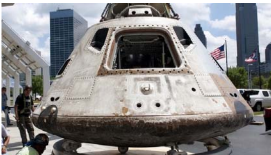
شکل ۶- در داخل یک کپسول فضایی آپولو به سوی ماه [۱۲].

در سال ۱۹۶۶ ناسا برنامه آپولو ۱۸ را آغاز نمود یعنی آخرین مرحله در راه رسیدن به ماه و نیز موشک حمل‌کننده زحل ۵ را ساخت که نیروی کافی برای حمل کپسول فضایی دارای سه سرنشین آپولو (شکل ۶) جهت فرود بر روی ماه را دارا بود ۱۹ .