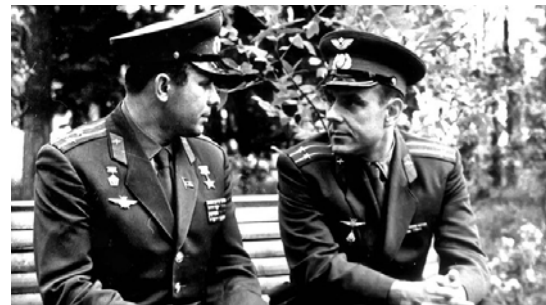
شکل ۹- فضانوردان در حال صحبت با هم: کاماروف (سمت راست) مشغول صحبت با گاکارین [۱۶].

در اواخر دهه ۱۹۶۰ شوروی برنامه جدیدی را آغاز کرد و چشم انداز جدیدش این بود: «زندگی و تحقیق در فضا». این کار می‌توانست بر روی یک مدار زمین و در داخل یک ایستگاه فضایی میسر شود. در سال ۱۹۷۱ سایوز ۱۰ ایستگاه فضایی سالیوت ۱ را به فضا برد. روس‌ها تا سال ۱۹۸۶ مشغول به جمع آوری تجربیات به توسط ایستگاه‌های فضایی سالیوت شدند که زمان کارایی شان محدود بود. سپس دوره ایستگاه فضایی میر ۳۷ در همین سال آغاز شد که اولین ایستگاه فضایی برای مدت طولانی و مبتنی بر روی عملیات علمی بود. اولین واحد این ایستگاه فضایی در سال ۱۹۸۶ آغاز به کار کرد و بقیه واحدها نیز بدنبال آن به کار مشغول گشتند. آمریکایی‌ها نیز می‌خواستند در فضا مشغول به تحقیقات شوند. آن‌ها برای این کار، در دهه ۱۹۷۰ توسعه شاتل‌های فضایی، که سفینه‌های فضایی مقرون به صرفه و قابل بازیابی بودند را در دست گرفتند و این شاتل‌ها، آزمایشگاه فضایی ۳۸ را برای چند روز به فضا بردند. اروپایی‌ها نیز برای اولین بار در این برنامه مشارکت داشتند. همچنین اتحاد جماهیر شوروی در دهه ۱۹۸۰ بر روی طرح شاتل سرمایه گذاری نمود: تولید فضایی بوران ۳۹ انجام گرفت که همتای شاتل فضایی ایالات متحده بود. بوران به دلیل مشکلات مالی و