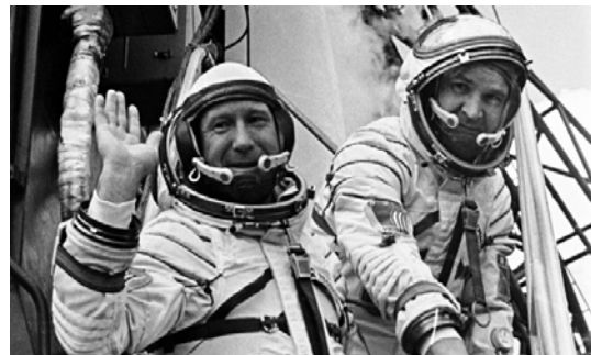
شکل ۴- آلکسی لئونوف (چپ) موفق به اولین راه رفتن در فضا می‌شود [۹].

فقط یک هفته بعد از آن، رئیس جمهور وقت آمریکا جان اف کندی اعلام کرد که ایالات متحده آمریکا تا اتمام دهه ۱۹۶۰ بر روی کره ماه فرود خواهد آمد. پس از آن، آمریکا در قالب برنامه مرکوری خود و شوروی در برنامه وووشود ۱۴ خود که آنرا در ۱۹۶۴ آغاز کرد [۸]، هر دو با هدف اعزام انسان به فضا پیش رفتند و رقابت فضایی شدیدتر از گذشته گردید. نهایتاً در اکتبر ۱۹۶۴ شوروی برای اولین بار سه فضانورد خود را همزمان به فضا فرستاد و در مأموریت وووشود ۲ آلکسی لئونوف (شکل ۴) روسی حتی موفق به اولین گردش در فضا شد که در حین انجام این کار نزدیک بود که جانش را از دست بدهد زیرا لباس فضانوردی اش باد کرد و او با مشکلات زیادی توانست راه خودش به سوی کپسول فضایی را به پشت سر برساند. و اما در این زمان آمریکایی‌ها می‌بایست نظاره گر می‌بودند که روس‌ها اکنون چگونه نگارش تاریخچه فضانوردی را به‌دست می‌گیرند.