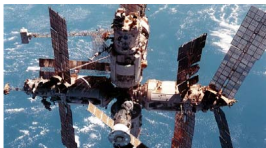
شکل ۱۱- ایستگاه فضایی میر (زندگی و تحقیق در فضا) [۱۸].

سیاسی نتوانست موفق به انجام مأموریت با سرنشین شود و در سال ۱۹۹۳ این برنامه برای همیشه متوقف گشت. پس از تغییرات بزرگ سیاسی در کشورهای بلوک شرق، سازمان فضایی اروپا ۴۰ نیز اقدام به مشارکت در برنامه فضایی روسیه نمود. در سال ۱۹۹۵ فضاپرواز آلمانی توماس رایتر برای مدت ۶ ماه در ایستگاه فضایی میر (شکل ۱۱) اقامت کرد. با تغییرات مجدد کشورها و از بین رفتن دیوار آلمان، برای امر اعزام انسان به فضا، امکانات جدیدی به وجود آمد و برای اولین بار دیگر مانعی بر سر راه همکاری‌های بین‌المللی در میان ملل فضاپرواز وجود نداشت.