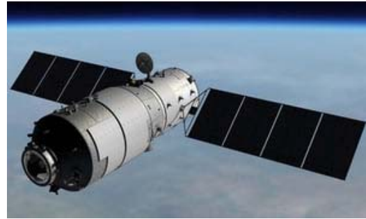
شکل ۱۷- ایستگاه فضایی تیان گونگ ۱ [۲۴].

سازمان‌های فضایی روسیه و هندوستان اکنون در حال برنامه ریزی مأموریت لونا ۲۷ (کاوشگران لونا) هستند. ۶۱ این طرح در نظر دارد به سوی هر کدام از دو کلاهک قطبی ماه دو کاوشگر بفرستد. آن‌ها وظیفه دارند که در آنجا به جستجوی آب و مواد خام بپردازند. از آنجا که شورای وزیران سازمان فضایی اروپا با مأموریت ماه که به توسط خود اروپایی‌ها انجام گیرد، مخالفت نموده است، سازمان فضایی اروپا می‌تواند در مأموریت