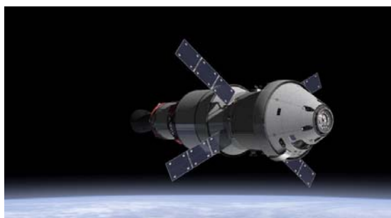
شکل ۱۴- امیدی نو؛ با کپسول فضایی اوریون به سوی ماه [۲۰].

ایالات متحده آمریکا، مجدداً ماه را بعنوان یک هدف ارزشمند در نظر گرفته است. در آینده قرار است که به وسیله فضایی‌های اوریون ۴۳ ، هر ساله دو مأموریت به سوی ماه آغاز شود. مجموعاً چهار فضاپرواز قرار است تا یک هفته بر روی ماه تحقیق نمایند. اوریون قبلاً از آزمایش‌های پروازی خودش موفق بیرون آمده است (شکل ۱۴). تنها چیزی که هنوز مورد نیاز می‌باشد، یک موشک حامل است که به قدر کافی قدرتمند باشد برای اینکه بتواند اوریون را تا ماه ببرد. سیستم حامل جدید، سیستم اس-ال-اس می‌باشد ۴۴ که در حال حاضر در حال توسعه و تکمیل است و باید اولین پرواز خودش را در سال ۲۰۱۸ با موفقیت به انجام رساند. در آینده دور، کره ماه می‌تواند به‌عنوان پایگاه برای اعزام انسان به کره مریخ نیز استفاده شود.