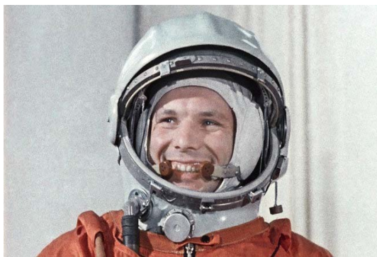
شکل ۲- یوری گاگارین، اولین انسان در فضا [۶].

آمریکایی‌ها نیز در سال ۱۹۵۹ به وسیله یک موشک رداستون ۱۲ میمونی را به نام سام برای مدت ۱۱ دقیقه به فضا فرستادند. به مرور زمان، هر دو ملت به ساختن کپسول‌های فضایی به جهت ارسال سالم و بدون آسیب موجود زنده و نهایتاً انسان به فضا اقدام نمودند اما باز دوباره این روس‌ها بودند که گوی سبقت را در کار اعزام انسان به فضا از آمریکایی‌ها ربودند، و در روز ۱۲ آوریل ۱۹۶۱ افسر ارتش روسی، یوری گاگارین (شکل ۲)، خبر جنجال برانگیزی را آفرید: شانس زنده ماندن او ۵۰ به ۵۰ تخمین زده می‌شد، اما او موفق به انجام این کار شد: یوری گاگارین بعنوان اولین انسان و به وسیله سفینه فضایی ووستوک ۱۳ در ظرف مدت ۱۰۶ دقیقه یک بار به دور زمین گردید و خوشبختانه پس از آن سالم به روی زمین بازگشت. این سبقت مجدد روس‌ها نیز یک شوک مجدد به آمریکایی‌ها بود.