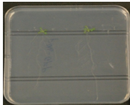
شکل ۲- نمونه یک محیط کشت برای گیاهان

علاوه بر آن رویان‌های تازه جوانه زده در بذر آراییدوپسیس تالیانا در معرض میکروگرانش شبیه‌سازی شده و در دستگاه کلینواستات سه‌بعدی برای ۹۶، ۴۸ و ۱۶۸ ساعت در دمای اتاق قرار گرفتند. از طرف دیگر نمونه‌های کنترل تحت شرایط مشابه و برای همان زمان بدون تنش‌های گرانشی مورد بررسی قرار گرفته‌اند. در تحقیق فوق، بیان نسبی ۱۲ ژن گیاه مورد آزمایش قرار گرفت و فعالیت آنزیم‌های اکسیدانی، محرک مکانیکی میکروگرانش مورد آزمایش قرار گرفتند. در ادامه رویان‌های تازه جوانه زده در بذر - آراییدوپسیس تالیانا با استفاده از دستگاه کلینواستات سه‌بعدی تحت تنش‌های میکروگرانشی قرار گرفته‌اند (به شکل شماره (۳) رجوع شود).