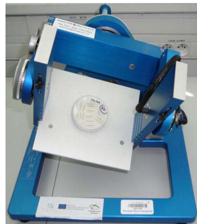
شکل ۳- دو نمونه دستگاه کلینواستات سه‌بعدی