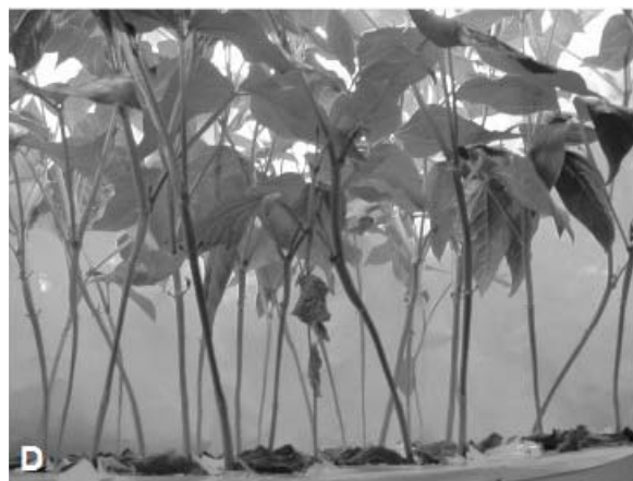
د) آرایش هوایی با کانوی نزدیک به لوبیای چشم بلبلی با لامپ‌های LED خاموش