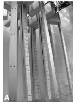
الف) سیستم نوری LED درون کانوی با لامپ‌های خاموش

فتوسنتز، رشد و گلدهی بهینه امکان‌پذیر است. طبیعت جامد و بادوام LED، سطح ساطع‌کننده نسبتاً خنک، عمر طولانی، قابل تنظیم بودن طیف، سطح تابش و توانایی حذف گرما این نور، آن را بهترین گزینه برای سیستم پشتیبان حیات کرده است. از