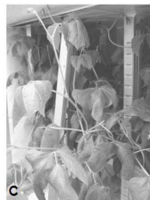
ج) آرایش درون کانوی را با کانوی نزدیک به گیاهان لوبیای چشم بلبلی با لامپ‌های LED خاموش