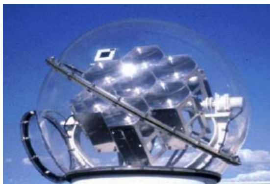
شکل ۱- سیستم چشم فیبری بر پایه لنز فرسنل [۶].

شده است که مجهز به یک کپسول رزین آکریلیک برای حفاظت همراه ۷ مینی لنز فرسنل شش ضلعی و یک حسگر نوری مربعی در گوشه بالایی سمت چپ لنزهاست [۶].