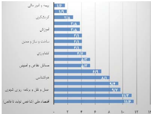
شکل ۹: سهم (درصد) مطالعات صورت گرفته در مورد بررسی اثرات اقتصادی-اجتماعی فعالیت‌های فضایی بر روی بخش‌های مختلف اقتصاد (۱۹۷۲-۲۰۱۸) [۳].

می‌رسد از آن زمان به بعد بخش‌های مختلف اقتصاد از اثرات اقتصادی-اجتماعی این گونه سرمایه‌گذاری‌ها منتفع شده‌اند. گزارش انجام شده توسط سازمان همکاری و توسعه اقتصادی در سال ۲۰۱۹ نشان می‌دهد که از حدود ۷۷ مطالعه صورت گرفته درباره اثرات اقتصادی-اجتماعی فعالیت‌های فضایی در بخش‌های اقتصادی در بازه زمانی ۱۹۷۲ تا ۲۰۱۸، دو حوزه اقتصاد ملی (با ۱۱/۶ درصد) و مسائل زیست محیطی (با ۱۱/۳ درصد) بیشترین مطالعات انجام شده را به خود اختصاص داده‌اند. شکل ۹ میزان سهم مطالعات صورت گرفته روی بعضی از بخش‌های اقتصادی در بازه زمانی مذکور را نشان می‌دهد [۳]. همچنین، از لحاظ نوع اثرات مثبتی که سرمایه‌گذاری‌های فضایی در پی دارند، درآمدهای تجاری با ۱۵/۴ درصد بیشترین سهم را به خود اختصاص داده است (شکل ۲).