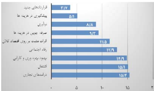
شکل ۱۰: سهم (درصد) انواع اثرات مثبت بدست آمده از سرمایه‌گذاری‌های فضایی (۱۹۷۳-۲۰۱۸) [۳].

در واقع، اجرای پروژه‌های فضایی باعث ایجاد جریان‌های درآمدی جدید برای شرکت‌های فعال در صنعت شده و این جریان‌های درآمدی اغلب به بخش‌های فراتر از صنعت فضایی نیز سرازیر می‌شود. یکی از پیامدهای این درآمدهای تجاری جدید خود را در بازار کار و ایجاد اشتغال جدید نشان می‌دهد.