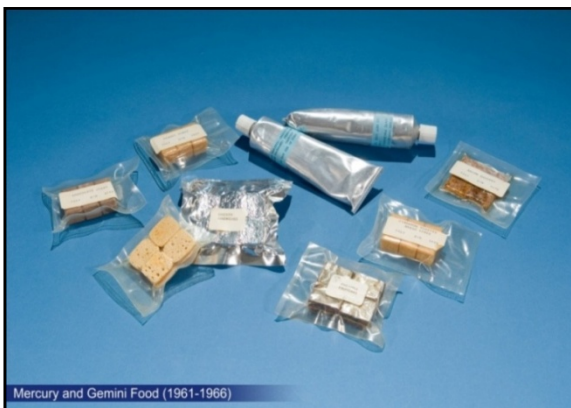
شکل ۱- غذای جمینی و مرکوری شامل: کیک میوه، ساندویچ مرغ، نان، شکلات و آجیل

در شاتل‌ها فریز و یخچال وجود ندارد؛ بلکه دستگاه تغذیه جدیدی برای شاتل‌ها طراحی شده است، به این صورت که اتاقکی در وسط کابین وجود دارد که دارای دستگاه‌های توزیع آب سرد و گرم، اجاق گاز، سینی‌های سرو غذا، انباری، سرویس‌های بهداشتی شخصی، آب گرمکن و جعبه کمک‌های اولیه است.