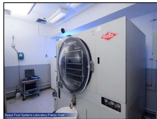
شکل ۵- سیستم FREEZ-DRYER آزمایشگاه سیستم‌های غذایی فضا