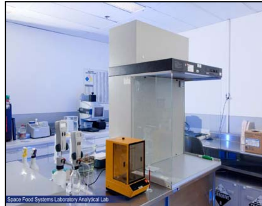
شکل ۴- اتاق بسته‌بندی آزمایشگاهی سیستم غذاهای فضایی

یکی از موارد مهم در تغذیه فضاوردان بسته‌بندی مواد غذایی است که باید شرایط خاص خودش را داشته باشد. به-گونه‌ای مواد غذایی انتخابی فضاوردان بسته بندی می‌شود که از نظر وزنی سبک باشد و به آسانی باز شود و امکان غذا خوردن در آن برای فضاوردان راحت باشد و همچنین دارای قسمت‌های تیز و برنده که باعث آسیب فضاوردان می‌شود، نباشد. بافت مواد غذایی از نظر ساختار و بسته‌بندی و پرس بودن بایستی بتواند در مقابل شوک‌های ماموریتی، تغییرات شتاب و ارتعاشات مقاومت داشته‌باشد و انسجام خود را از دست ندهد. بسته‌بندی‌ها به گونه‌ای باشند که با چسب‌های کاغذی به سینی غذا متصل شوند. بسته‌بندی، ظاهر و رنگ مناسب با ذائقه فرد داشته باشند. هر فرد باید بتواند به راحتی بسته غذایی متناسب به ذائقه خود را تشخیص داده و استفاده کند. پرس یا دوخت بسته‌بندی‌ها باید به نیروهای ناشی از تغییرات فشار مقاوم باشد. در هنگام استفاده از مواد غذایی جنس ماده بسته‌بندی‌کننده به گونه‌ای نباشد که باعث خرد شدن یا چسبیده شدن مواد غذایی به آن شود. در شکل (۷) و شکل (۸) بسته‌بندی مواد غذایی و صرف غذا نشان داده شده است. هر بسته‌بندی مواد غذایی باید دارای کد تعیین‌کننده مشخصات غذا و تاریخ و نوع مصرف آن باشد. حتی باید دستورالعمل آماده‌سازی آن غذا بروی آن ذکر شده باشد. در برنامه‌های فضایی روسیه بیشتر غذاها به صورت کنسروی در قوطی‌ها بسته‌بندی می‌شوند. با قوطی بازکن در آن را باز کرده و از الکتریسته برای گرم کردن استفاده می‌کنند و به‌طور مستقیم از داخل قوطی غذا می‌خورند [۱۴].