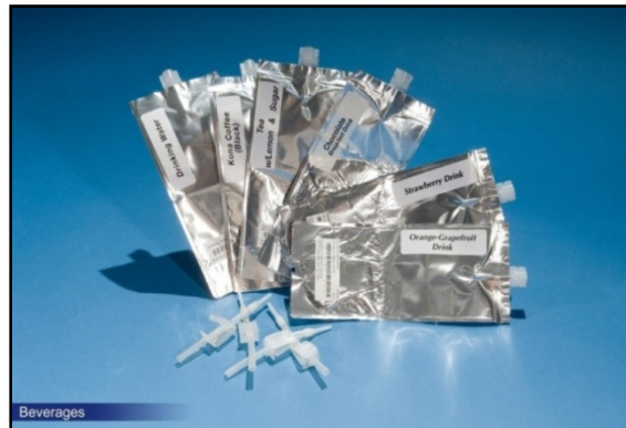
شکل ۲- بسته‌بندی مواد غذایی فضانوردان