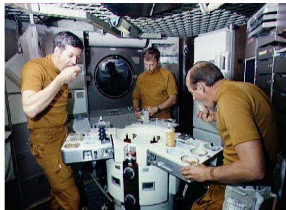
شکل ۳- تصویر خدمه پروازی اسکای لب ۲ در حال غذاخوردن

دو مؤلفه مهم در مورد مواد غذایی؛ مواد مغذی لازم و انرژی (کالری) است. از آنجاکه مصرف مقدار کافی کالری بدون در نظر گرفتن مواد مغذی لازم می‌تواند منجر به کاهش سلامت و راندمان جسمی خدمه پروازی در مأموریت‌های فضایی شود، بنابراین آشنایی با نیازهای تغذیه‌ای فضانوردان در طول مأموریت حایز اهمیت است.